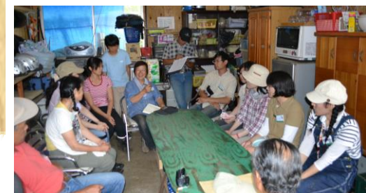
ばからん終了後の話し合い