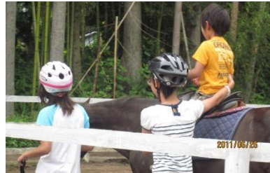
引き馬をはじめゲームなども、野あそび会の子どもたちが運営していきました