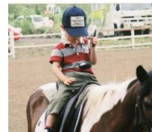
パン食い競争、蹄鉄投げ、ピンポン玉運びのゲームは馬に乗ってやりました