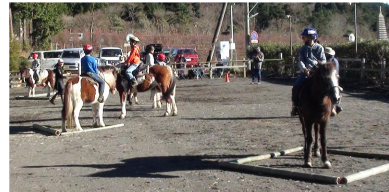
運動会での「いす取りゲーム」→竹で囲ったスペースは馬の頭数よりひとつ少ない。笛の合図でスペースの中に馬を入れるが、次の笛が鳴るまで入っていられるかな？